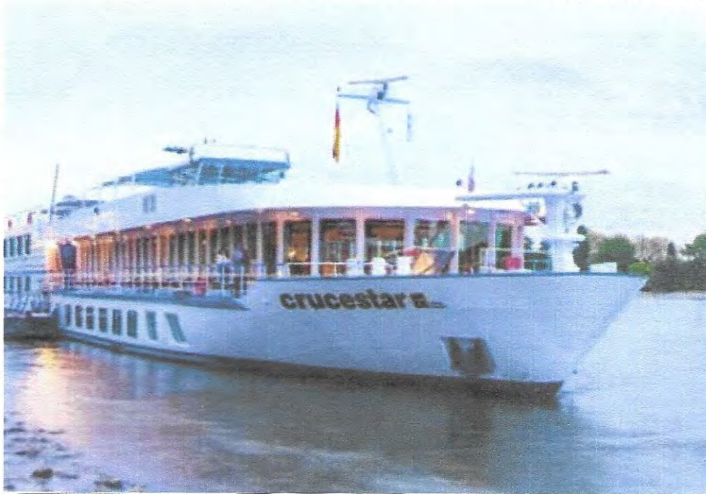
vous aurez le temps de visiter les jarc