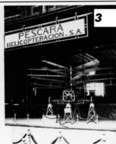
Paris – Grand Palais 1921