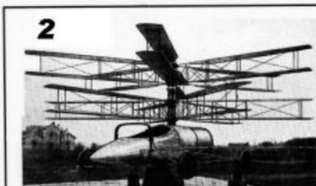
Présentation à Barcelone 1919, au STAé Photo illustrant dans le Larousse le mot hélicoptère de 1922 à 1940