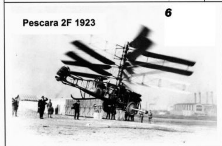
Pescara 2F 1923