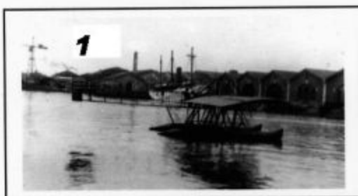
Hydravion Pateras-Pescara Venise 1912

1911 Le Laboratoire d'Eiffel à Paris accueille le projet de Raoul Pateras-Pescara qui a 21 ans.