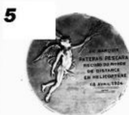
1924 – Record du monde de distance en ligne droite ( 736 m ) 18 avril enregistré par la F.A.I.