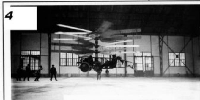
Pescara 2R en 1922