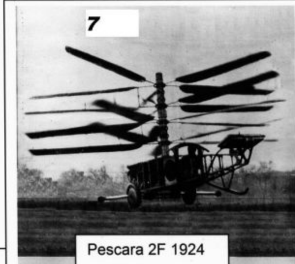
Pescara 2F 1924