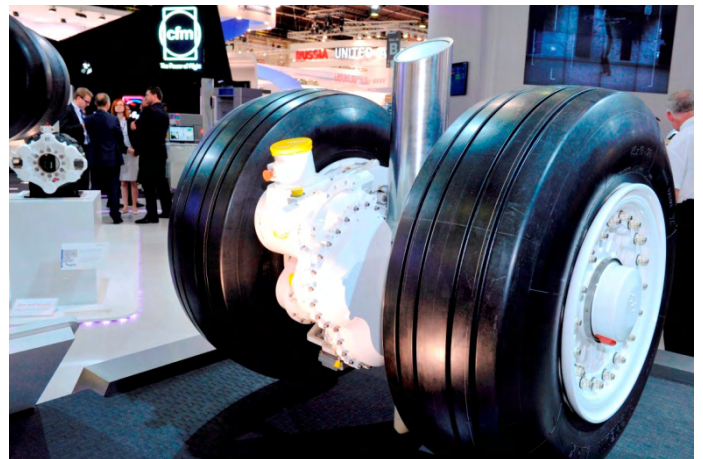
l'A320 au taxiage, et détail de l'actionneur entre les roues principales