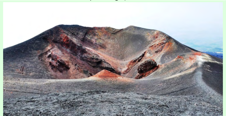
Deux des très nombreux cratères de l'Etna