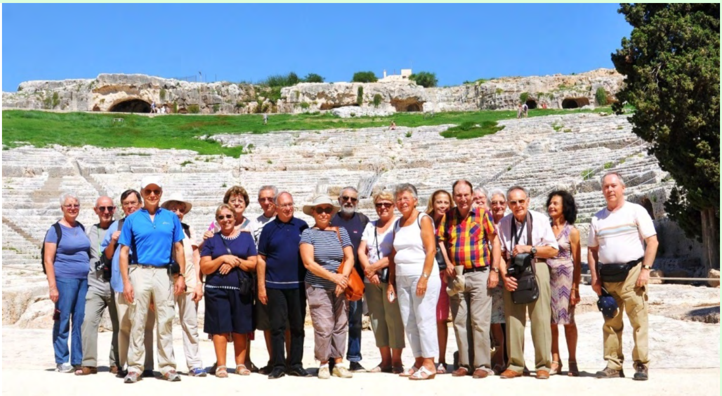
Taormina - Théâtre gréco-romain bien conservé, situé dans un cadre magnifique entre Etna, partie montagneuse avec ses châteaux, et la mer. L'été, des spectacles y sont présentés. (La troupe présente sur la photo est seulement de passage)